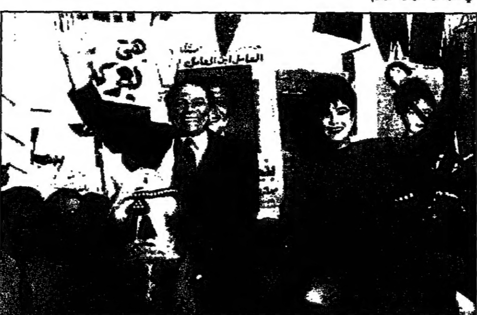
مشهد من اخر افعال عادل امام والجمهور والكتبة